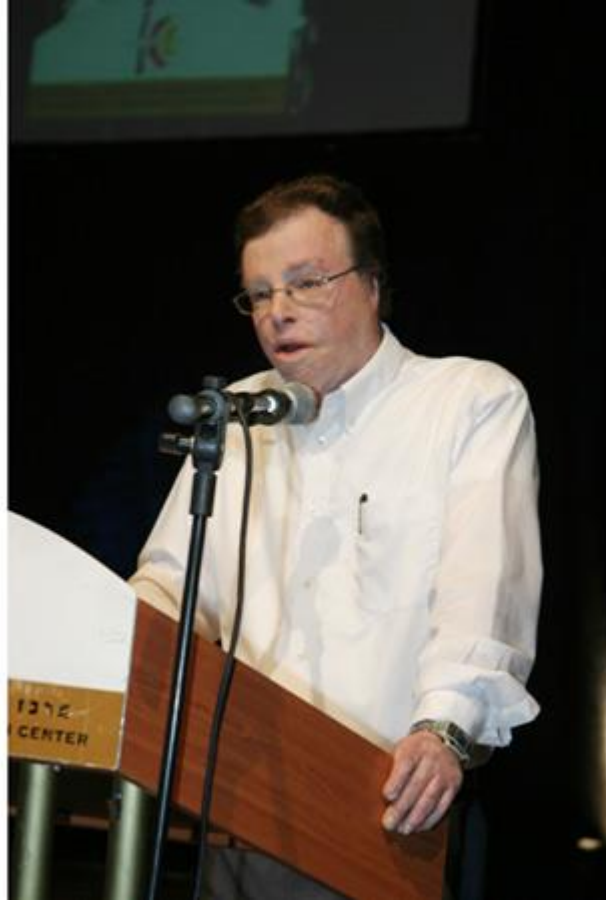
אבו נאביל , מלווה בריבית –